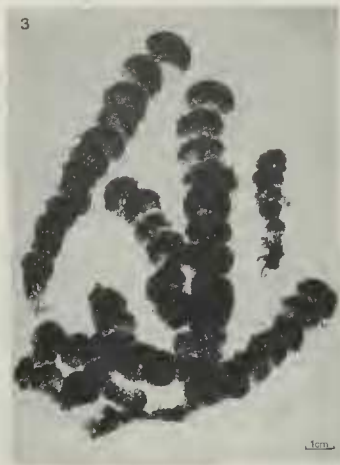
Fig. 3. — Différents aspects de frondes gloméruliformes de Tydemania expeditionis récoltées dans le golfe d'Aqaba.

Plusieurs plongées, effectuées sur les côtes jordaniennes du golfe d'Aqaba à l'automne 1978, nous ont permis de récolter plusieurs thalles de Tydemania , entre 8 m et 20 m, dans trois sites différents (fig. 1 et 2).